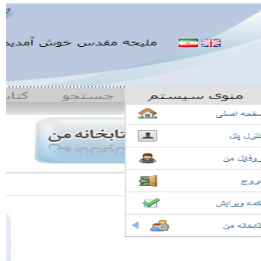
شکل 4- گزینه های منوی سیستم