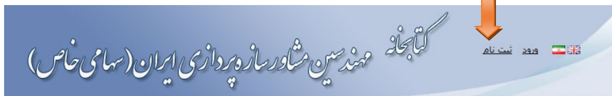
شکل 1- ثبت نام