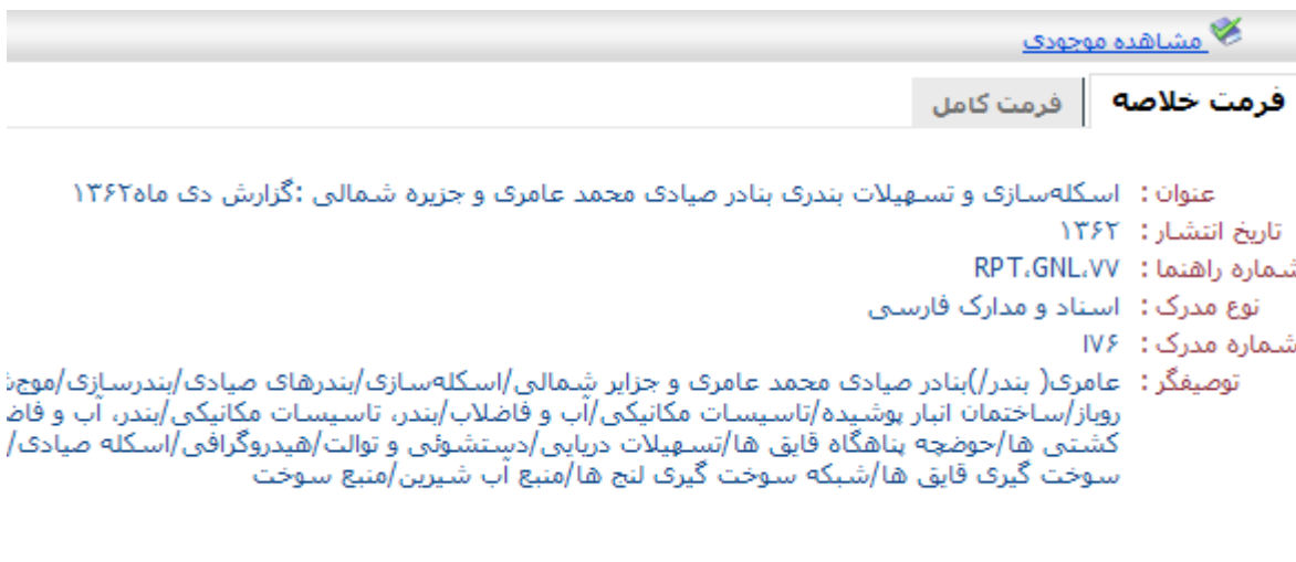
شکل 5- فرم خلاصه/کامل مدرک

در این مرحله جهت اطلاع از موجود یا امانت بودن مدرک مورد نظر بر روی گزینه "مشاهده موجودی" کلیک نمایید. جدول موجود، وضعیت مدرک در بخش امانت را نشان می دهد. (شکل 11)