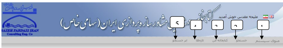
شکل 3- گزینه های نوار منو

پس از درج اطلاعات کاربر، سیستم به صورت خودکار یک کلمه عبور برای آن در نظر می‌گیرد. با استفاده از کلمه عبور موردنظر کاربر وارد سیستم شده و نسبت به تغییر آن و تکمیل سایر مراحل ثبت نام اقدام مینماید. در این مرحله نام کاربری و کلمه عبور برای کاربر مشخص می‌گردد. صفحه هر کاربر شامل گزینه های یکسانی است، در ادامه توضیحاتی در رابطه با این گزینه‌ها به ترتیب شماره ارائه گردیده است: