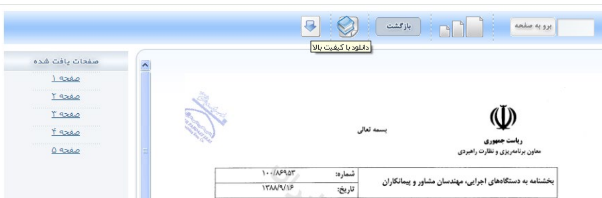
شکل 73- نمایش مدرک

در بالای صفحه که با علامت پیکان رو به پایین مشخص شده، جهت دریافت کامل فایل اقدام می‌شود. شکل (13)